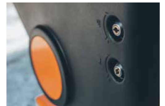
Réglage latéral D601

En option, on peut commander la K-BASIC 2 ou la K-TRONIC 2 comme télécommande ou les équiper ultérieurement.